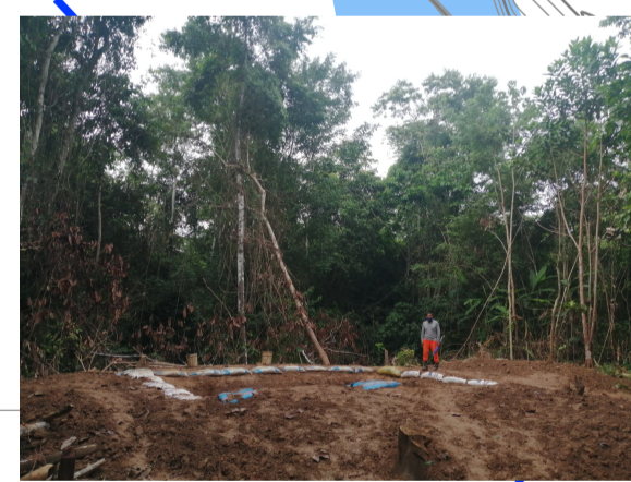
B3 - Botadero actual Barrio Eni