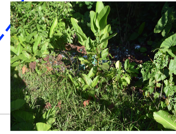
B4 - Botadero comunal Antiguo