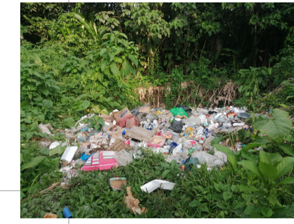
B5 - Botadero actual Barrio las Palmeras