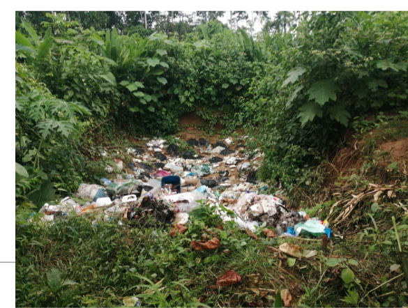
B1 - Botadero actual Barrio Miraflores