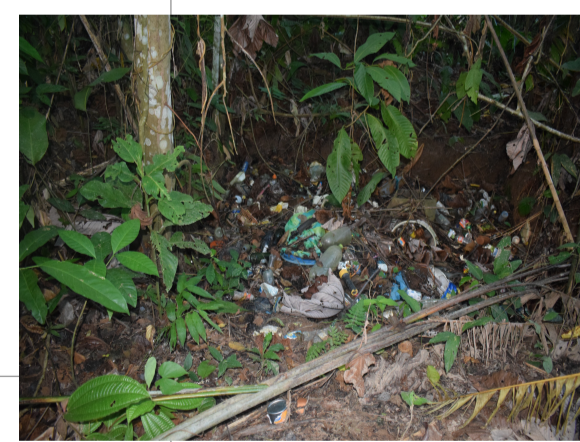
B2 - Botadero antiguo Barrio Eni