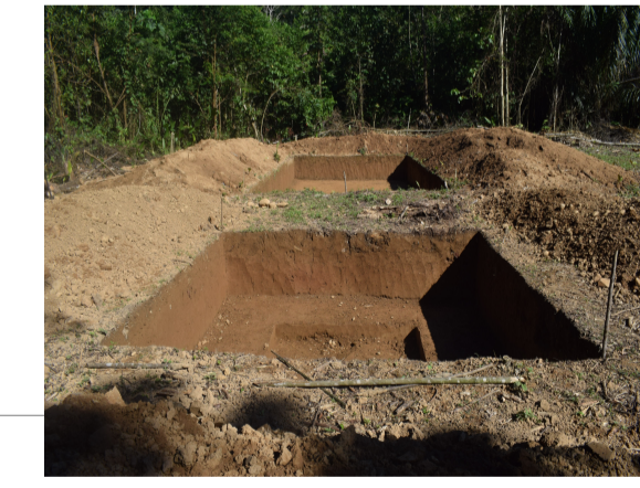
B6 - Botadero comunal en construcción