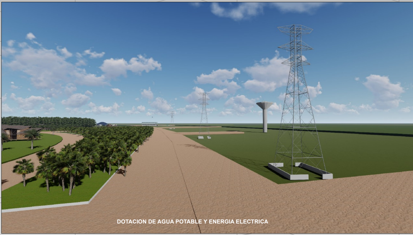
DOTACION DE AGUA POTABLE Y ENERGIA ELECTRICA