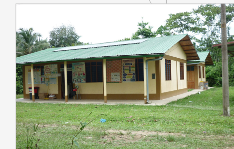
M. CONSTRUCCION: CONCRETO - MADERA