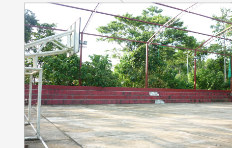
M. CONSTRUCCION: CONCRETO