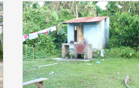
M. CONSTRUCCION: LADRILLO- MADERA