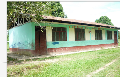
M. CONSTRUCCION: ADOBE