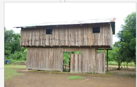
M. CONSTRUCCION: MADERA